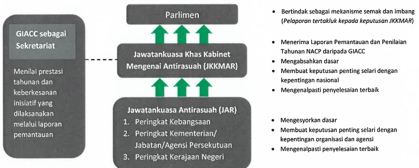
Rajah 1: Struktur Tadbir Urus Pelan Antirasuah Nasional

5.2.1 Struktur tadbir urus pelaksanaan dan pemantauan NACP hendaklah menggunakan struktur mekanisme pengurusan governans, integriti dan antirasuah kebangsaan sebagaimana Arahan YAB Perdana Menteri No. 1 Tahun 2018 dengan menjadikan isu NACP sebagai salah satu agenda mesyuarat sepertimana di Rajah 1.